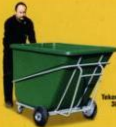
Tekerlek çapı 30 cm.