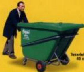
Tekerlek çapı 40 cm.